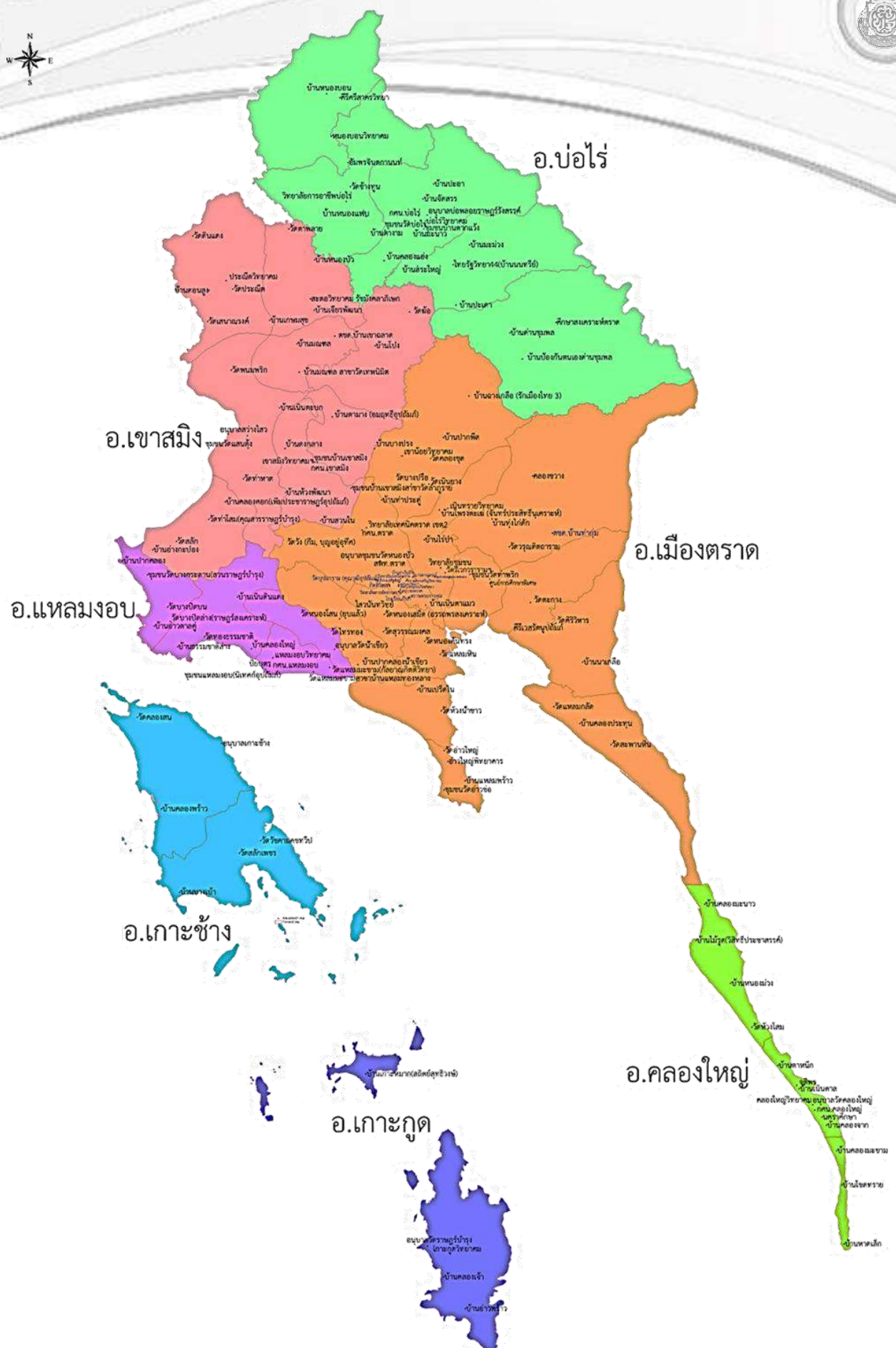
แผนภาพที่ ๗ แผนที่ตั้งสถานศึกษา สังกัดสำนักงานเขตพื้นที่การศึกษาประถมศึกษาตราด

กลุ่มนโยบายและแผน : สำนักงานเขตพื้นที่การศึกษาประถมศึกษาตราด