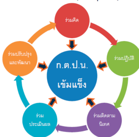
ภาพที่ ๒ รูปแบบการบริหารจัดการสร้างความเข้มแข็งให้แก่คณะกรรมการ ก.ต.ป.น.

ร่วมคิด (Thinking Participation) หมายถึง ผู้มีส่วนได้ส่วนเสียร่วมคิดวางแผนการติดตามการกำหนดตัวชี้วัด ในการพัฒนาคุณภาพการศึกษาโดยมุ่งผลสัมฤทธิ์ของหน่วยงานและสถานศึกษาในสังกัดสำนักงานเขตพื้นที่การศึกษาประถมศึกษาตราด เพื่อเตรียมการรับการนิเทศ ติดตามและประเมินผลจากหน่วยงานภายนอก