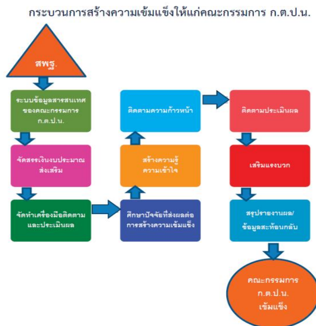
ภาพที่ ๓ กระบวนการสร้างความเข้มแข็งให้แก่คณะกรรมการ ก.ต.ป.น.

ร่วมปรับปรุงและพัฒนา ( Improve and develop Participation) หมายถึง คณะกรรมการติดตาม ตรวจสอบ ประเมินผล และนิเทศการศึกษา ของสำนักงานเขตพื้นที่การศึกษาประถมศึกษาตราด มีส่วนร่วมในการสรุปผลและรายงานผลการดำเนินงานต่อต้นสังกัดในด้านวิชาการ ด้านงบประมาณ ด้านการบริหารงานบุคคลและด้านการบริหารงานทั่วไป และนำผลการประเมินมาปรับปรุงและพัฒนาของสำนักงานเขตพื้นที่การศึกษาประถมศึกษาตราด